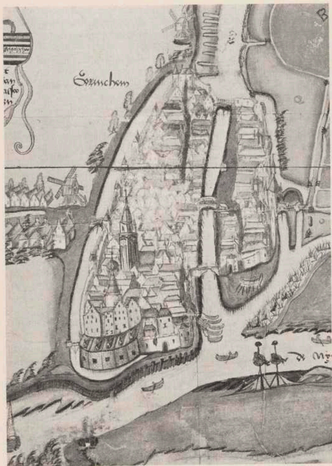
Kaart van Gorinchem, onderdeel van een grotere kaart door Pieter Sluyter, 1553. Algemeen Rijksarchief 's-Gravenhage.