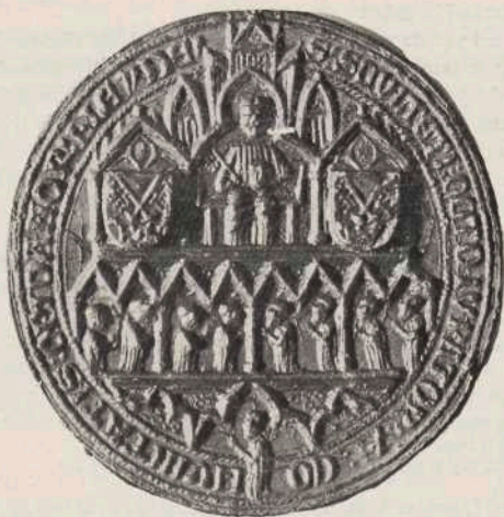
Stadszegels van Leiden.